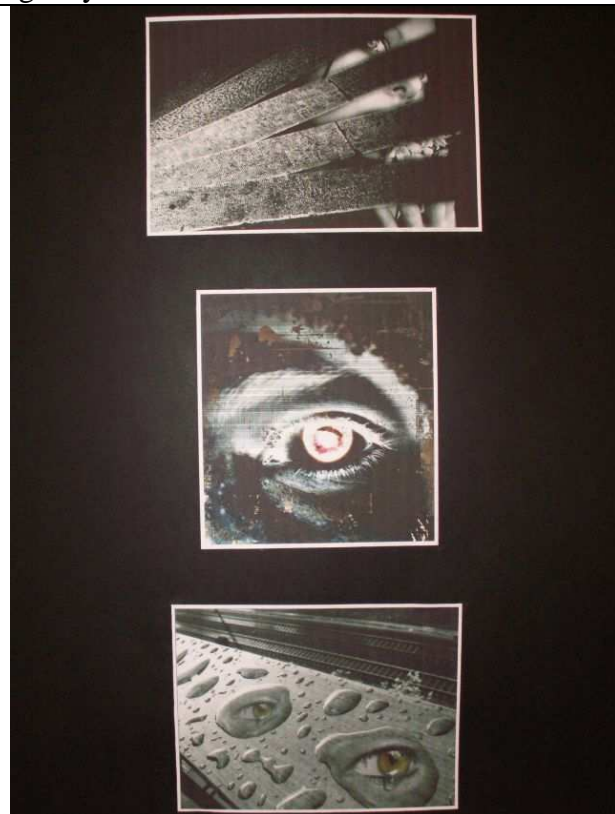
Számítógépes grafika Balló Tamás Pogány Frigyes Kéttannyelvű Építőipari Szakközépiskola és Gimnázium